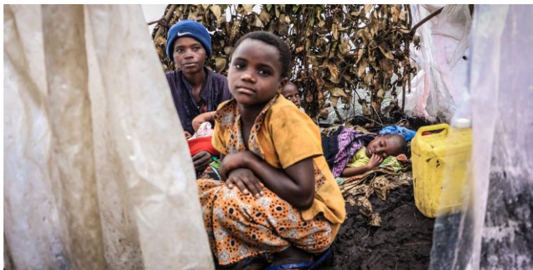
Cette photo témoigne de la vulnérabilité extrême des enfants réfugiés internes dans les zones de conflit.

Les conditions de vie de ces déplacés sont précaires à l'image de ces enfants déplacés.